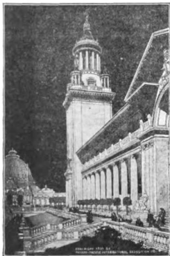
Palaco de Edukado

konstruado estos finita kelkajn monaĵojn antaŭ la destinita dato, kaj dum la tiama lastaj malmultaj semajnoj oni perfektigos ĉion.