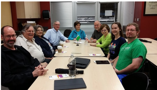
A meeting of the North Texas group.

The Esperanto Club of North Texas is an informal club that meets in the Dallas-Fort Worth area. We typically have ten to twenty participants in our meetings. We have a website and a mailing list for conversations between meetings.