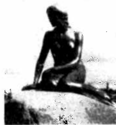
– kaj la marvirineto

Infanoj en la tuta mondo konas la fabelojn de H. C. Andersen, kaj maristojn de ĉiuj nacioj bonvenigis kaj adiaŭis la marvirineto de la fabelo, kies gracia bronza statuo gardas la entrejon al la kopenhaga haveno. Jena libreto estas saluto de tiu Danio, kiu estis la patrio de la granda fabel-poeto, kaj kiu etendiĝas jarmilaĝa kaj eterne juna malantaŭ la fama vidaĵo de la Langelinie-promenejo.