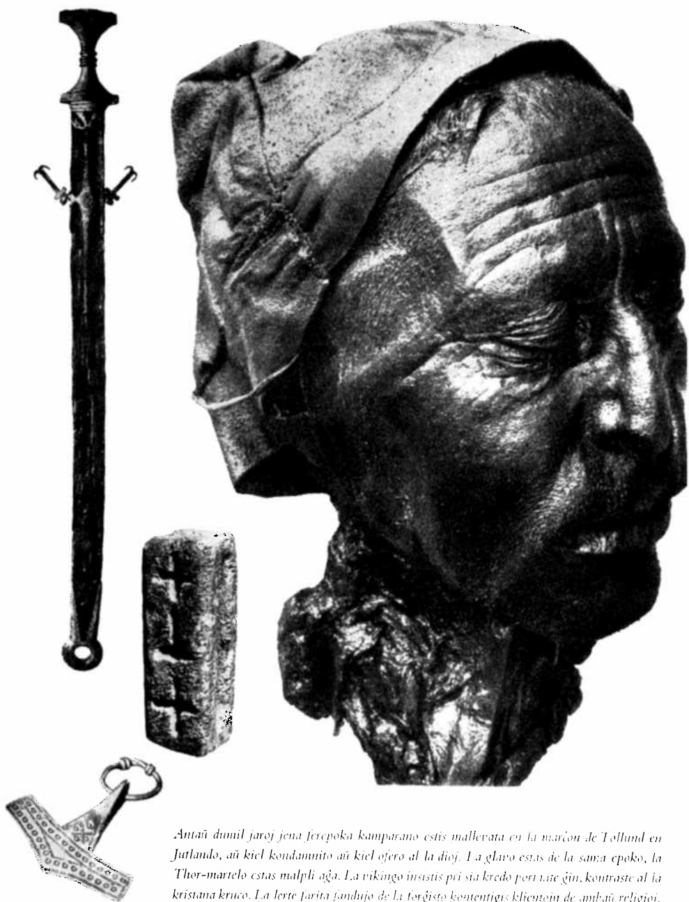
Antaŭ du mil jaroj jena ferepoka kamparano estis malliberata en la marĉon de Tollund en Jutlando, aŭ kiel kondamnito aŭ kiel ofero al la dioj. La glavo estas de la sama epoko, la Thor-martelo estas malpli aĝa. La vikingo insistis pri sia kredo per tute ĝin, kontraste al la kristana kruco. La lerte farita fandiĵo de la forĝisto kontentigis klientojn de ambaŭ religioj.