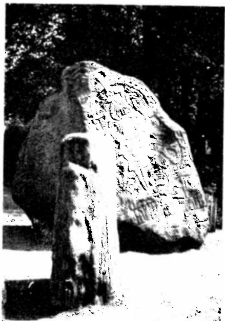
Ĉe la preĝejo en Jelling staras du monumentoj. La marveĝo Gorm la Malgranda metas sian kiel monumenton pri sia edzino, kaj la filo Harald Blåtand metas la alian por memoriĝi pri siaj gepatroj. «Tiu Harald, kio konkritis inter Danion kun Norvegio kaj kristanigis la landon».

En la koro de Jutlando la lando forte leviĝas kaj malleviĝas. Belaj lagoj kaj krutaj montetoj igas la jutlandanon paroli pri «montoj» la «Ĉielmonto», pli modestan nomon li ne povas trovi por la arbarkovrita monteto ĉe la lago de Juul.