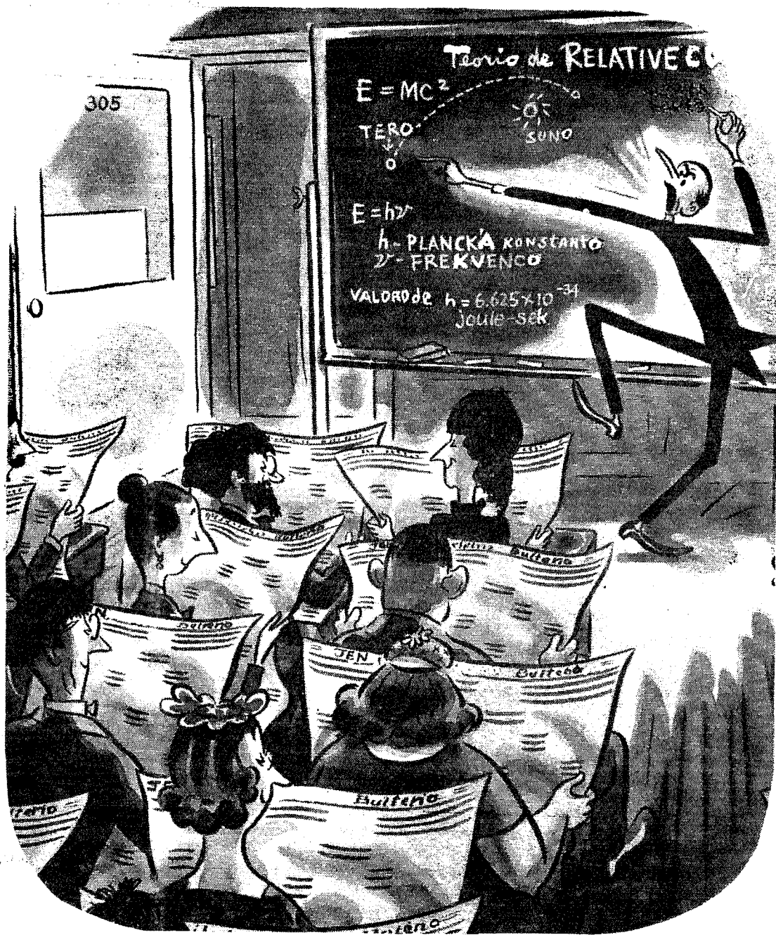
Êe Harvard, preskaũ Êiu legas la JEN-Bultenon.