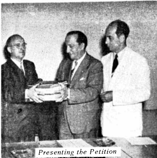
Presenting the Petition